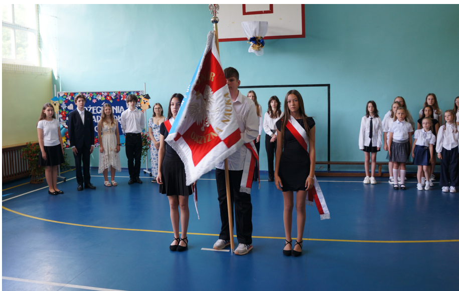
Szkoła Podstawowa nr 2 im. Lotników Polskich w Mierzęcicach