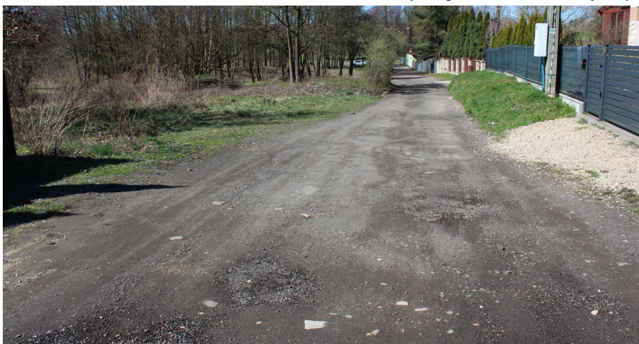
Modernizacja drogi - Przeczycy ul. Stawowa - przed