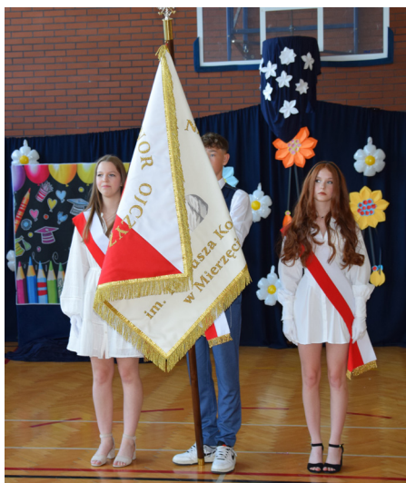
SP nr 1 im. Tadeusza Kościuszki w Mierzęcicach