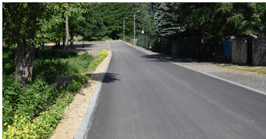
Modernizacja drogi - Przeczycy ul. Stawowa - po