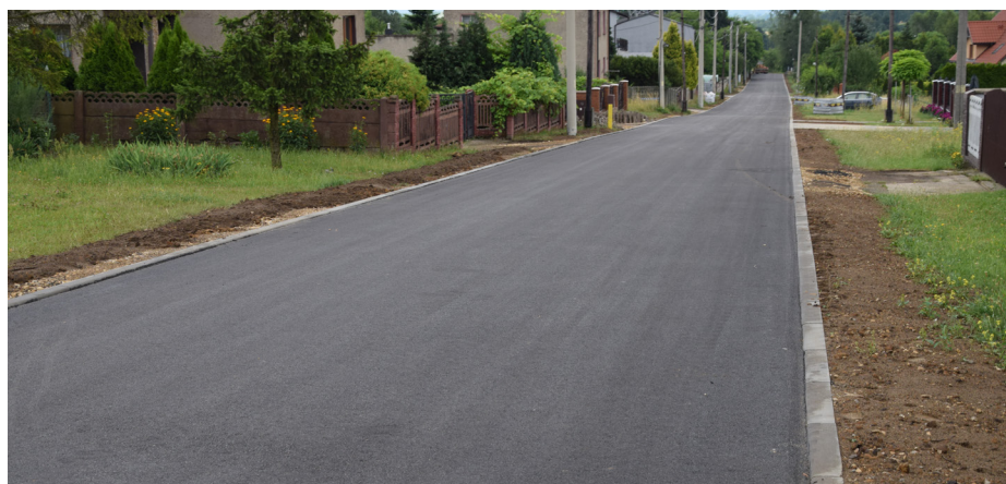
Modernizacja drogi - Zawada ul. Nowowiejska - po