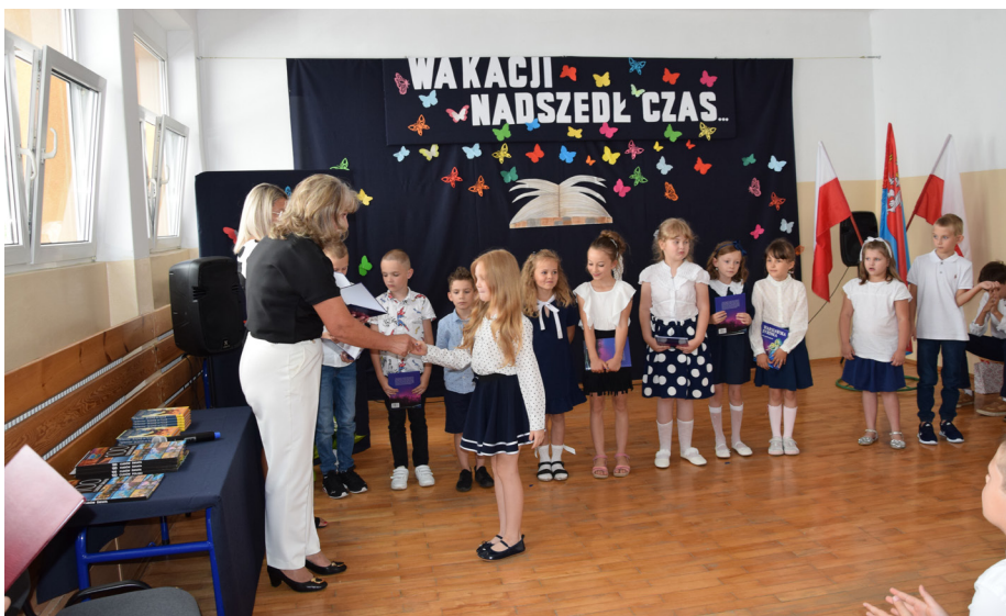
Szkoła Podstawowa im. M. Konopnickiej w Przeczycach