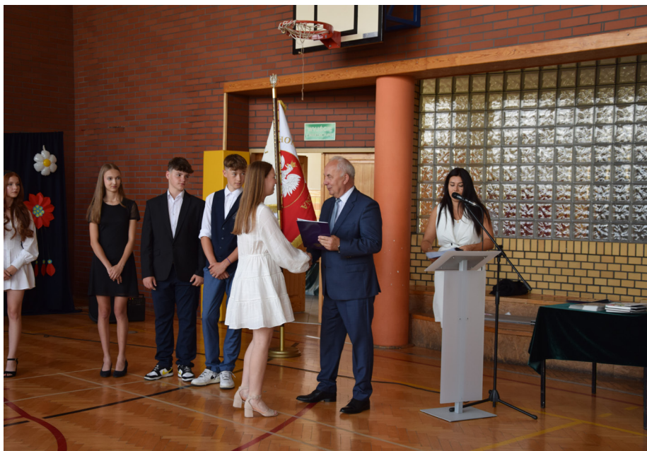
Szkoła Podstawowa nr 1 im. Tadeusza Kościuszki w Mierzęcicach