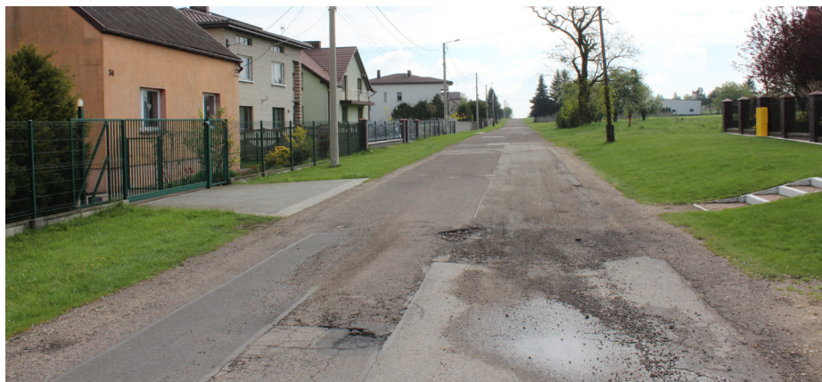
Modernizacja drogi - Zawada ul. Nowowiejska - przed

Nakład: 1200 egz. Druk: „Magic” s.c. Będzin - Grodziec