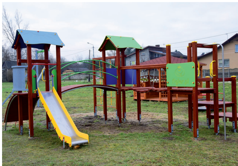
Plac zabaw przy ul. Młyńskiej w Przeczycach