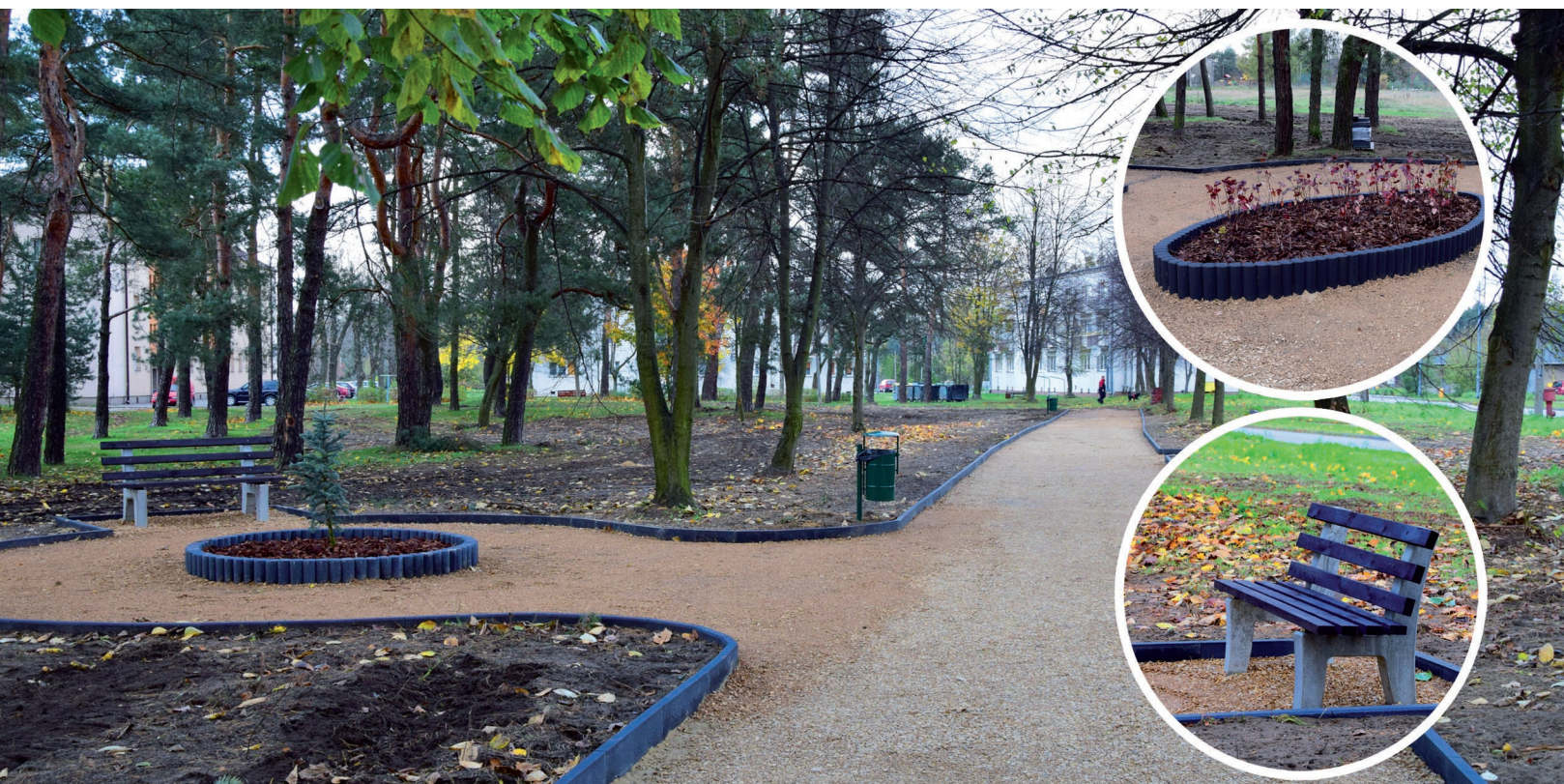
Miejsce do wypoczynku w Mierzęcicach Osiedlu