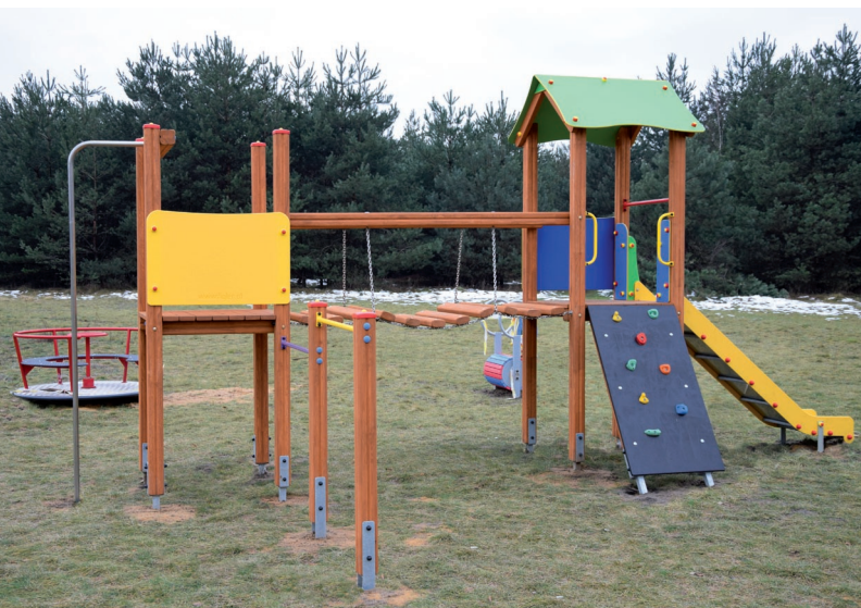
Plac zabaw przy ul. Leśnej w Mierzęcicach